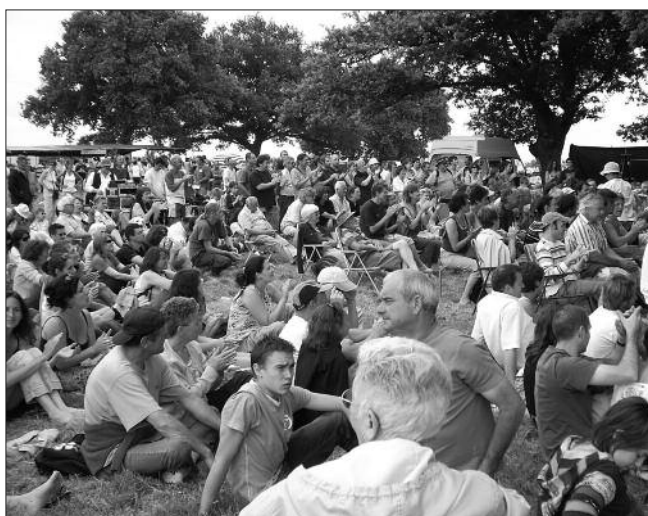
Lors du dernier pique-nique de l'ACIPA, en juin dernier, les citoyens se sont déplacés nombreux, pour faire état de leur opposition et de leur vigilance face à l'aveuglement de certains de leurs élus.

Tous ceux et celles avec qui nous échangeons, quand nous tenons le stand d'information de la